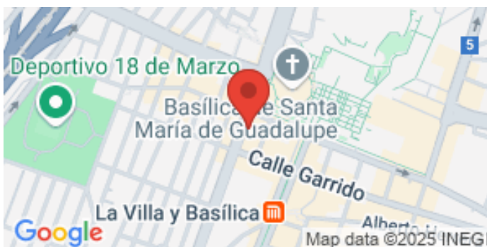
La imagen muestra el inmueble consultado, para ver los inmuebles catalogados del mismo Municipio / Alcaldía acceda a la sección de Localización de la página web./

Otra localización También colonias Vallejo, Tepeyac Insurgentes e Industrial en la delegación Gustavo A. Madero. Colonia Peralvillo en la delegación Cuauhtémoc.