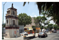
Vista del Misterio de la Adoración de los Reyes. 2010.

Nombre: Misterios del Rosario Tipo y subtipo de ficha: CONJUNTO RELIGIOSO Clave de ficha: C-09-01362