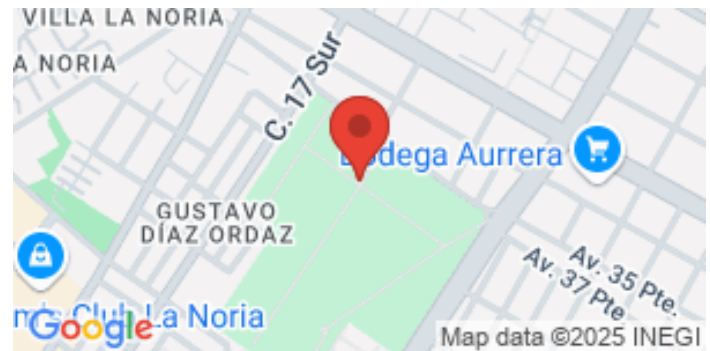
La imagen muestra el inmueble consultado, para ver los inmuebles catalogados del mismo Municipio / Alcaldía acceda a la sección de Localización de la página web./