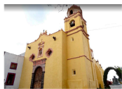
Fachada, 2018. Fuente Google Maps.

Nombre: Parroquia de Santa María Tepepan Tipo y subtipo de ficha: INMUEBLE RELIGIOSO Clave de ficha: I-09-02298