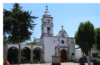
Fachada principal. 2018

Nombre: Templo de San Bernabé Tipo y subtipo de ficha: INMUEBLE RELIGIOSO Clave de ficha: I-09-02085