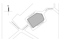
Croquis de localización. 2018.