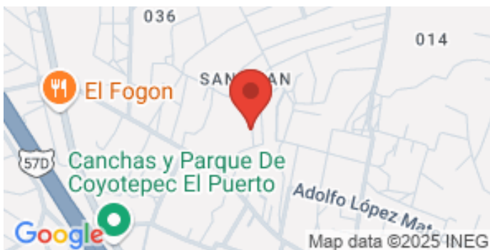
La imagen muestra el inmueble consultado, para ver los inmuebles catalogados del mismo Municipio / Alcaldía acceda a la sección de Localización de la página web./

Frente a Calzada de los Misterios no. 308