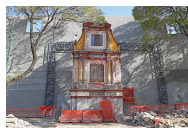
Fotografía, año 2017.

Nombre: Misterio Doloroso del Rosario: La Oración en el Huerto Tipo y subtipo de ficha: INMUEBLE RELIGIOSO Clave de ficha: I-09-01368